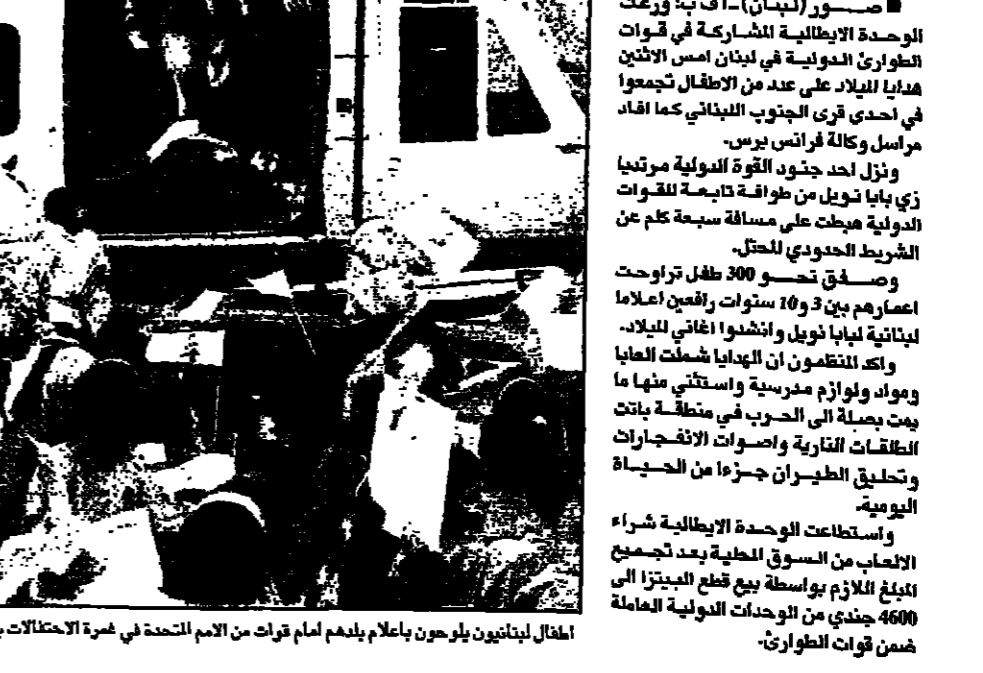
اطفال لبنانيون يلعبون بالهدايا بلدهم امام قرات من الامم المتحدة في عمرة الاحتفالات باياد

الوحدة الدولية للمشاركة في قوات الطوارئ الدولية في لبنان امس الاثنين هدايا الميلاد على عدد من الاطفال تجمعا في إحدى قرى الجنوب اللبناني كما افاد مراسل وكالة فرانس برس. ونزل احد جنود القوة الدولية مرتجيا زي يملك نول من طوافة تابعة للقوات الدولية هيملت على مسافة سبعة كلم من الشريط الحدودي للجنوب. وصفق نحو 200 طفل تراوحت اعمارهم بين 3 و16 سنوات رافعين اعلاما لبنانية لبها نول ونحوها اغاني الميلاد. وكان التجمع في احياء ضمت لها مواد ولوازم مصرية واستقبلت منها ما يمت بجملة الى الحرب في منطقة باتت للقتال القارية واصوات الانفجارات وتحليل الطيران جزءا من الحياة اليومية. واستطاعت الوحدة الإيطالية شراء الاطباء من السوق المحلية بعد تجميخ ابلق الايام بواسطة بيع قطع البضاعة 4600 جندي من الوحدات الدولية العاملة ضمن قوات الطوارئ.